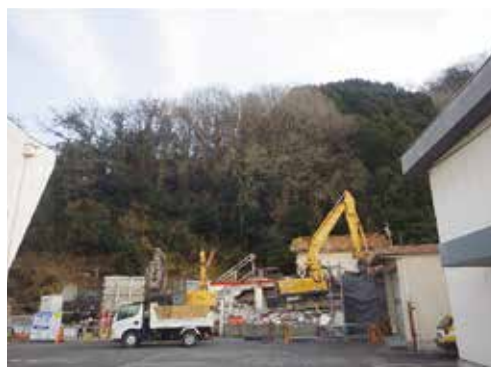
施 工 前