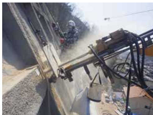
鉄筋挿入工 削孔状況

3段法面を各段施工で行うように設計されていたため、各工種毎の調整や工程管理に苦悩しました。複数の作業が重なる際は作業打ち合わせをより綿密に行い、作業に支障をきたすことや事故が発生することの無いように人員配置や作業員同士の連絡調整に注力しました。